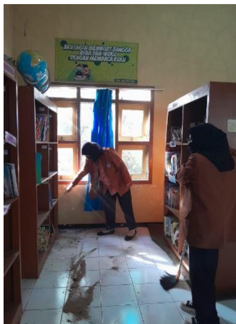
Gambar 1. Pembersihan ruang Perpustakaan

karakter. Karakter dapat dilihat sebagai nilai-nilai perilaku manusia (Ayupradani et al., 2021). Pembentukan budaya literasi melibatkan komponen penting seperti kegiatan membaca dan menulis. Dengan demikian, dapat disimpulkan bahwa kegiatan membaca dan menulis adalah langkah awal dalam membangun budaya literasi. Hal ini penting agar siswa dapat meningkatkan kemampuannya dalam mengakses informasi dan pengetahuan (Mahardhani et al., 2021). Beragam manfaat dari budaya literasi menjadikan alasan kuat mengapa kegiatan ini perlu dikembangkan. Dengan menciptakan sumber daya manusia yang cerdas dan terampil membaca, kehidupan dan kemajuan pendidikan di suatu negara dapat ditingkatkan.