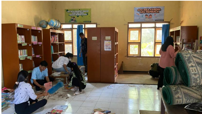
Gambar 2. Pembersihan ruang Perpustakaan

perpustakaan akan menjadi tempat yang lebih menyenangkan untuk belajar dan membaca.