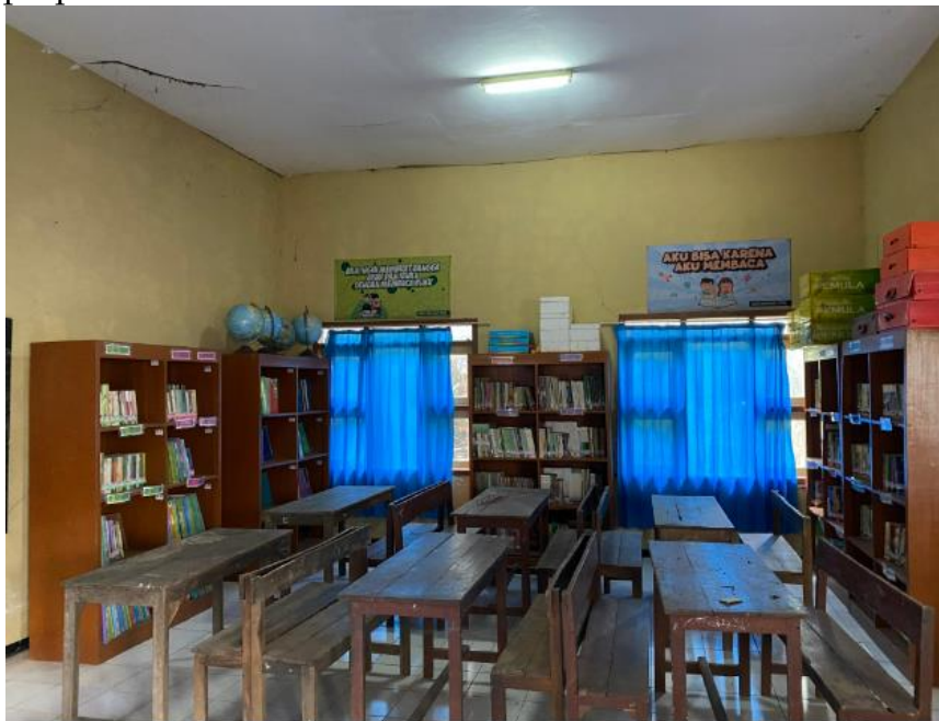
Gambar 3. Penataan ruang Perpustakaan

Kenyamanan ini tidak hanya dirasakan oleh tim KKN, tetapi juga oleh seluruh siswa SD Negeri Jatisari 2 Kecamatan Pakisaji. Mereka dapat membaca buku saat jam istirahat atau mengerjakan tugas dengan suasana yang nyaman di perpustakaan. Selain itu, sejumlah barang yang sudah didata dan perlu ditambahkan ke perpustakaan, seperti rak sepatu, kemoceng, sapu ijuk, keset, dan tempat alat tulis, telah diidentifikasi untuk meningkatkan kenyamanan dan fungsionalitas perpustakaan.